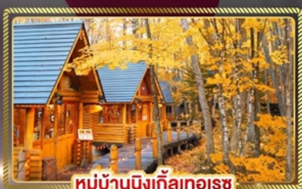
หมู่บ้านนิงเกิ้ลทอเรซ