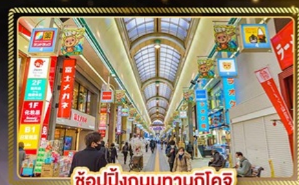
ช้อปปิ้งถนนทานุกิโคจิ