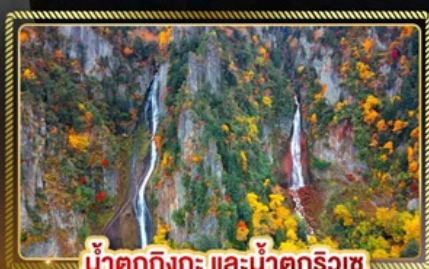
น้ำตกกิงกะ และน้ำตกริวเซ