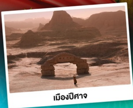
เมืองปีศาจ