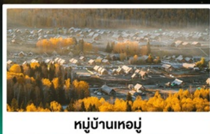
หมู่บ้านโฮมู