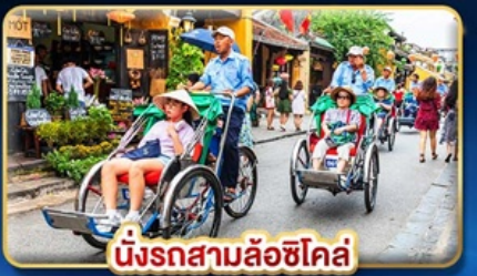
นั่งรถสามล้อซิโค่