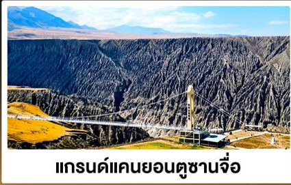
แกรนด์แคนยอนตูชานจื่อ