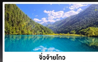
จิว๋จ้ายโกว