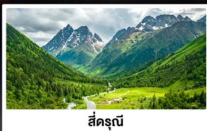
สี่ครุณี