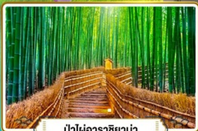
ป่าไฟอาราชิยาม่า