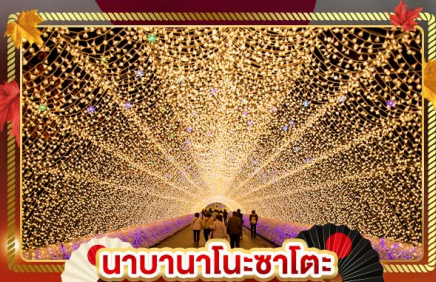
น้ำบานานาโอะซาโตะ

"ชมความงามของฤดูใบไม้เปลี่ยนสี" เที่ยวครบจบทุกไฮไลท์ โอซาก้า-โตเกียว พิเศษ!! บินเรือแบบ FULL SERVICE