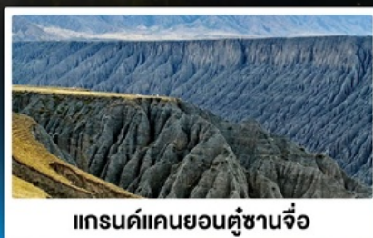
แกรนด์แคนยอนคู้ซานจื่อ