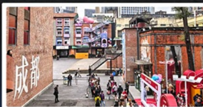
ตงเจียวจื้ออี้