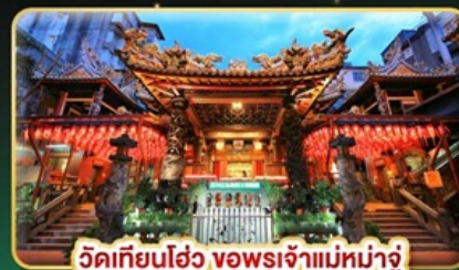
วัดเทียนฮั่ว ขอพระเจ้าแม่หม่าจู