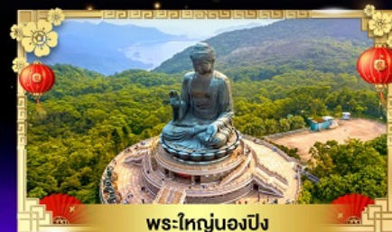
พระใหญ่หนองปิง