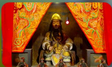
องค์แขกเก่า 600 ปี