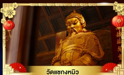
วัดแซกหมีว