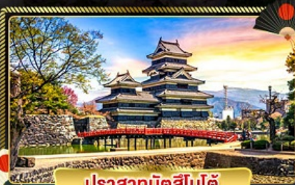
ปราสาทมิตสึโมโด้