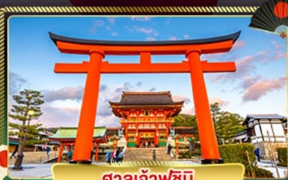
ศาลเจ้าฟูชิมิ