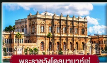
พระรารังโฒมาบารุช

ลัฒพัสดินแดน 2 ทวับ ตุรเด็ย ฟรี! ไอศครัฒท่านละ 1 SCOOP