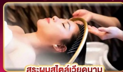
สปาผสมสไตล์เวียดนาม