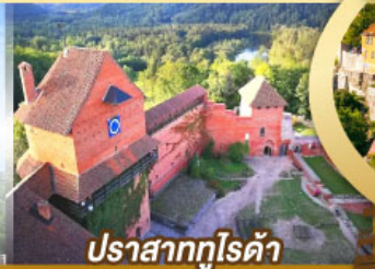
ปราสาทกูไรดา