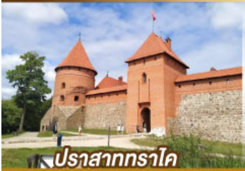
ปราสาททราโค