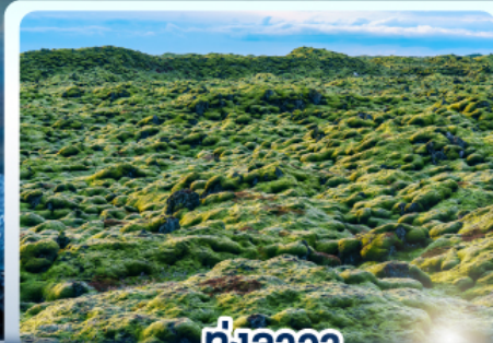
ทุ่งลาวา