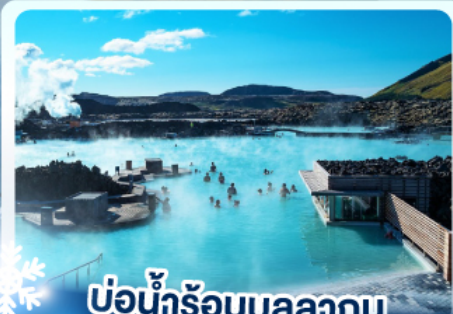
แช่น้ำร้อนบลูลากูน

เก็บไอซ์แลนด์ แคนกูเวาไฟเคิร์กจูเฟล และ แช่น้ำร้อนบลูลากูน