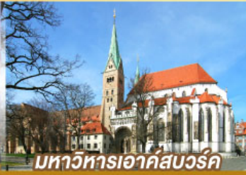
มหาวิหารเอาค์สเวิร์ค