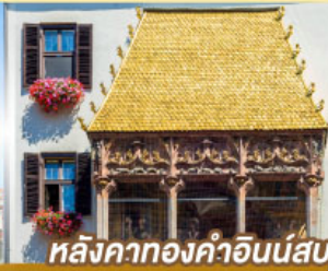
หลังคาทองคำอินน์สบูร์ค