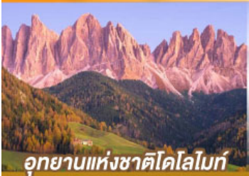
อุทยานแห่งชาติโดโลไมท์