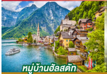
หมู่บ้านอัลสติก