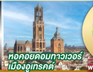
หอคอยคอมทาวเวอร์ เมืองอูเทรคต์