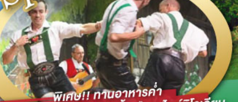
พิเศษ!! ทานอาหารค่ำ พร้อมชมการแสดงดนตรีพื้นเมืองสไตร์เลีย และเยือนเมืองอูเทรคต์ สีสันใหม่เนเธอร์แลนด์

ไฮไลท์ในโปรแกรม • เยือนเมืองแห่งแคว้นบาวาเรีย และ ทิโรล • สนุกสนานเหมืองเกลือบิรชเทสกาเดิน • เข้าชมปราสาทอชวานสไตน์ • เดินเล่นจัตุรัสโรเมอร์ ซอปปิง Zeil Street • ถ่ายรูปมุมสวยของหมู่บ้านอัลสติก • ชิลๆ ไปในเมืองซาลสบูร์ก บ้านเกิดโมสาร์ท • ล่องเรือหมู่บ้านกีธูร์น และ ล่องเรือชมนครอัมสเตอร์ดัม • ซอปปิงจุ้ย่านคัมสแควร์และเดินเล่นย่านโคมแดง