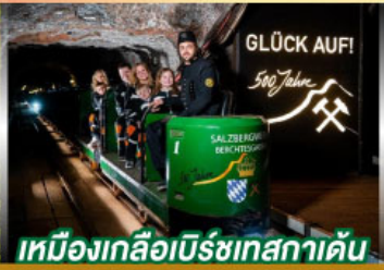
เหมืองเกลือบิรชเทสกาเดิน