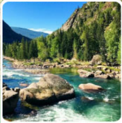
อุทยานเคอเคอทั้วไ้