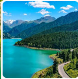
อุทยานเทียนชาน เทียนฉือ