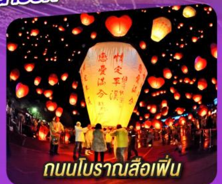
ถนนโบราณลือเฟิ่น