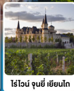
ไรไวน์ จุนยี เยียนโก