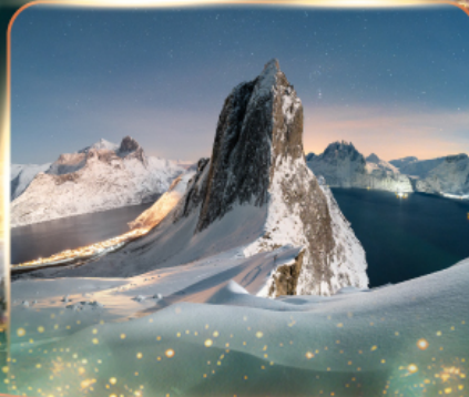
เกาะเซนญา