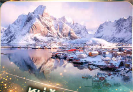
หมู่บ้านเรนเน

นอร์เวย์ แสงเหนือสุดฟิน เช็किनสุดจ๊าว 10 วัน 7 คืน