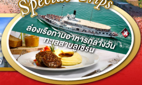
ล่องเรือทานอาหารกลางวัน ทะเลสาบลูเซิร์น