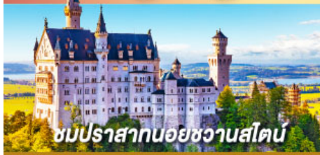
ชมปราสาทนอยชวานสไตน์