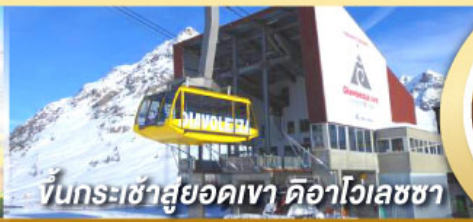
ขึ้นกระเช้าสู่ยอดเขา ดือาไวเลซซา