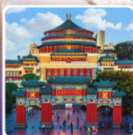
ศาลาประชาคมดงซิ่ง