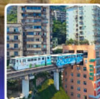
รถไฟทกะสุดติก