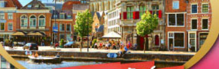
เก็บครบเบเนลักซ์ แวะเที่ยวฮาร์เล็ม