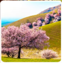
ทุ่งดอกอัลมอนด์