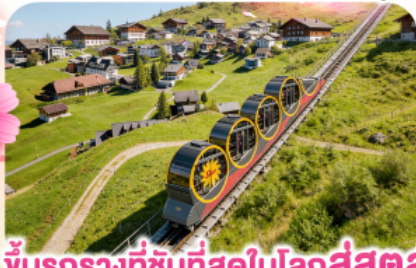
ขัั้นรรางที่ชันที่สุดในโลกสู่สตูล

พิชิตยอดเขาชุนเนกกา 1 ในเขาที่สวยงามที่สุดเมืองเซอร์แมท