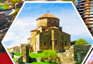
วิหารจอร์