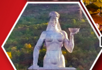
อนุสาวรีย์ มารดาแห่งจอร์เจีย