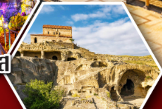
เมืองถ้ำอพิลิสต์ซิคห์