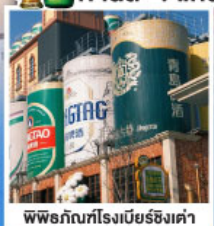
พิพิธภัณฑ์โรงเบียร์ชิงเต่า