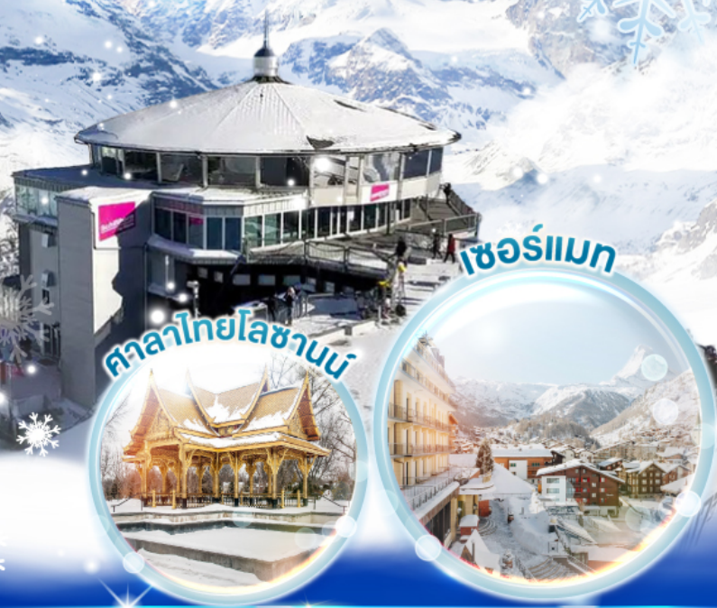
ศาลาไทยโลซานน์