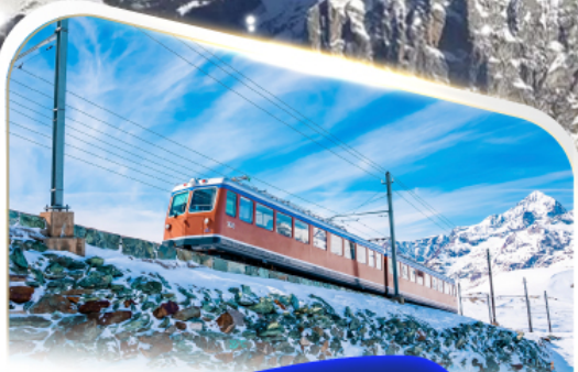
ขึ้นรถไฟฟันที่ฟ็องกอนนอร์แกรต