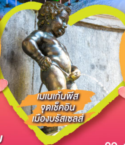
เมเนกันพิส จุดเซ็คอิน เมืองบริสซาซลส์