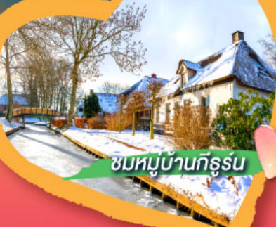
ชมหมู่บ้านกังหัน