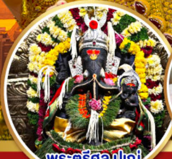
พระตรีศูล ปูเน่ (Trishul Pune)