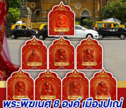
พระพิฆเนศ 8 องค์ เมืองปูเน่