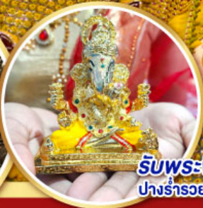
รับพระพิฆเนศวร ปางรำรอย ท่านละ 1 องค์