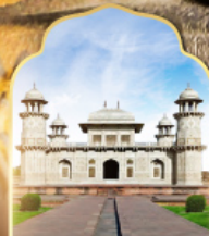
ทัชมาฮาลน้อย