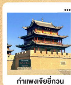
กำแพงเจียกวน