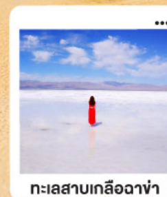
ทะเลสาบเกลือฉางซ่า