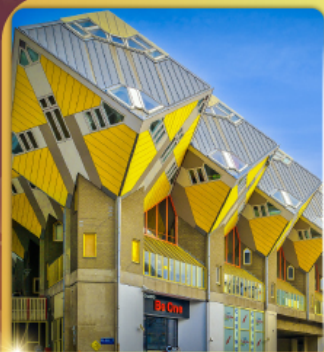
บ้านลูกเต๋า โคกคึมุส