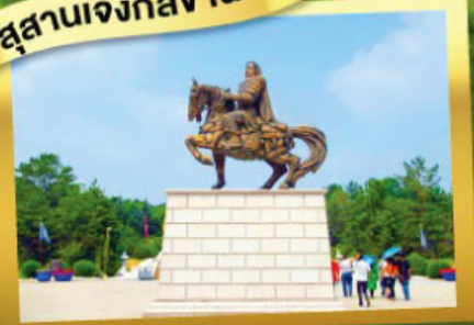
เนินทรายสีงชาวน