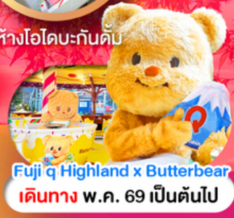
Fuji q Highland x Butterbear เดินทาง พ.ค. 69 เป็นต้นไป