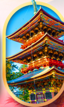
วัดนาริตะชิน