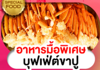
อาหารมือพิเศษ บุฟเฟ่ต์งาปู