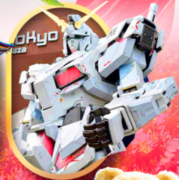
ห้างไอโดเบะกันดั้ม