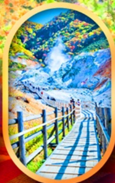
หุบเขานรกจิกอดาคานิ