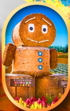
ซึกิไซ โนะ-โอกะ