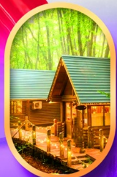
นิงเกิลทอเรียส