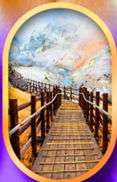
จิกอคุดานิ