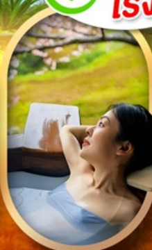
แช่บ่อออนเซ็นญี่ปุ่น