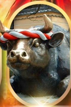
ศาลเจ้าดาไซฟุ