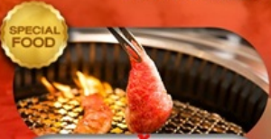
อาหารมือพิเศษ ปิ้งย่างยากินิกุ