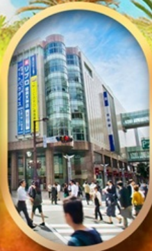
ช้อปปิ้งย่านกินจิน