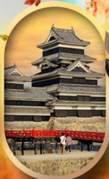
ปราสาทคумаโมโตะ