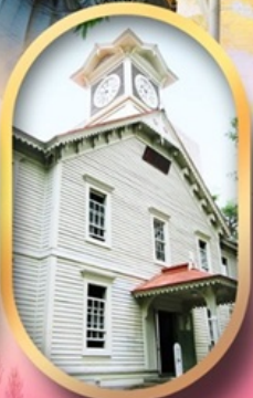
ผ่านชมหอนาฬิกา