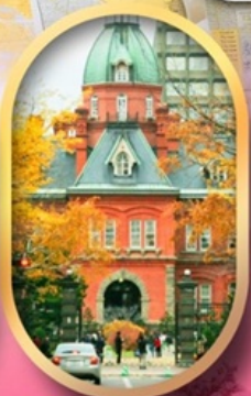
ศาลาว่าการเก่า