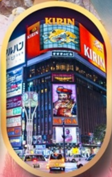
ช้อปปิ้งย่านซูซุกิโนะ