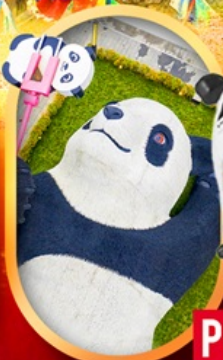
หมีแพนด้าเซลฟ์