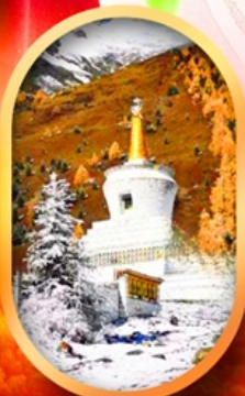
อุทยานสี่ฤดู