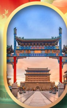
ถนนคนเดินเจียนเหมิน