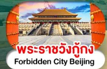
พระราชวังกู้กง Forbidden City Beijing