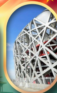
ผ่านชมสนามกีฬาฟาริงก