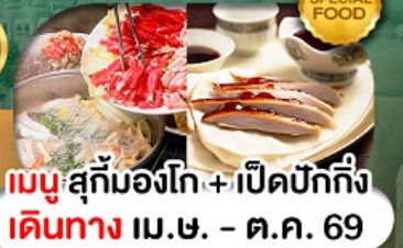
เมนู สุกี้มองโก + เปิดปักกิ่ง เดินทาง เม.ษ. - ต.ค. 69