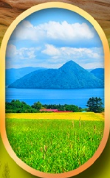
ทะเลสาบโทเยะ