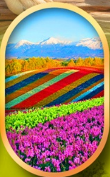
สวนดอกไม้ซึกิโซ