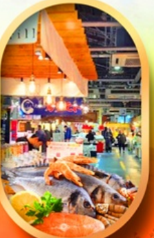
ตลาดปลาฮงโกะ