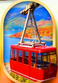
ขึ้นกระเช้าทะเลสาบมิกะตะ