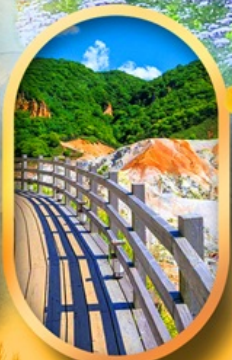
โนโบริเบทส์