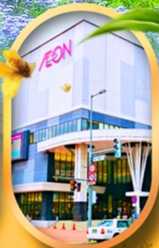
อ็อนมอลล์