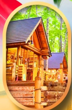
นิงเกิลทอรัส