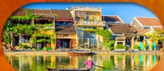
HoiAn Ancient Town ย่านเมืองเก่าฮอยอัน

เวียดนามกลาง ดานัง ฮอยอัน เที่ยวบานาฮิลล์