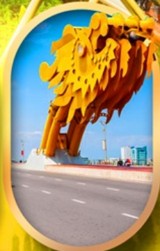
สะพานมังกรคานัง