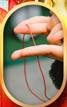
เสริมดวงความรัก