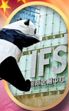
IFS หนีแพนด้าปีนตึก