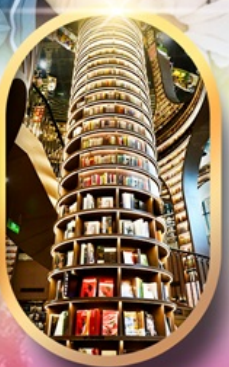
หอหนังสือจงซูเก๋อ