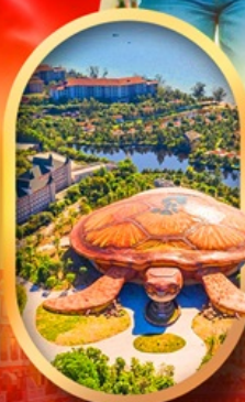
พิพิธภัณฑ์สัตว์น้ำ