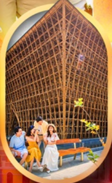
อาคารไม้ไฟ