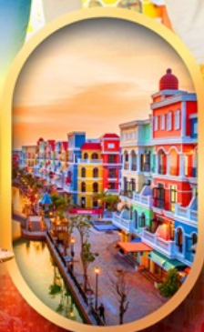
เวนิสแห่งเวียดนาม