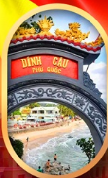
ศาลเจ้าดิงเกา