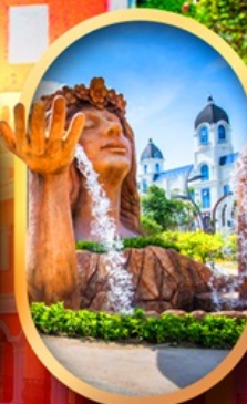
น้ำตกเทพหญิง